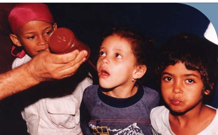
Aplicação de flúor em crianças da creche Casulo Noêmia Velloso no início das atividades em 1990 Fluoride application on the children of the Casulo Noêmia Velloso childcare center at the beginning of its activities in 1990

METHODOLOGY GUARANTEES ORAL HYGIENE TO THE CHILDREN IN OURO PRETO – The attendance program implemented in the Smile Project Foundation adopts the Inverse Attention methodology strategy in controlling the epidemic.