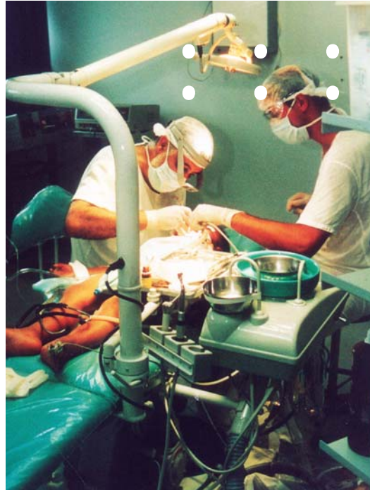
Reabilitação realizada na unidade portátil com anestesia geral Rehabilitation performed in the movable unit under general anesthesia

Para a obtenção dos resultados, são fundamentais as aplicações dos procedimentos e a frequência das crianças que estão em tratamento. Para isso, semanalmente e de acordo com escalonamento pré-estabelecido, a criança freqüenta a unidade acompanhada dos pais ou do responsável para a realização da escovação supervisionada, bochecho com flúor e uso de fio dental. Nesse período, recebe a orientação necessária para manutenção de uma boca saudável. Periodicamente, a criança é submetida à evidenciação de placa bacteriana antes da escovação. A cada três meses, é aplicado o flúor-gel tópico e, semestralmente, as escovas de dente são trocadas. Todo o material é fornecido gratuitamente às crianças. •